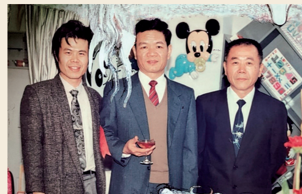
1990年明清牙科診所喬遷開幕時，與舅舅(中)、父親(右)合影 (親舅舅是我的榜樣，同樣苦讀有成，最後成為國策顧問 & 台大教授。)