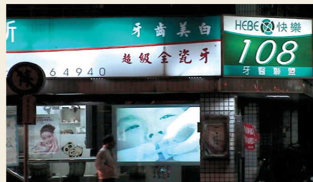
會說話的玻璃牆 - 首創牙醫院外口腔衛教系統