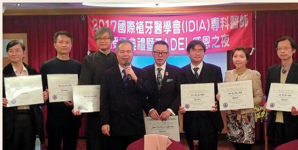
2017主持國際植牙學會(IDIA)最高院士授證典禮