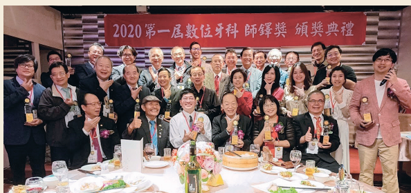
主辦2020第一屆數位牙科師鐸獎，50位講師受獎