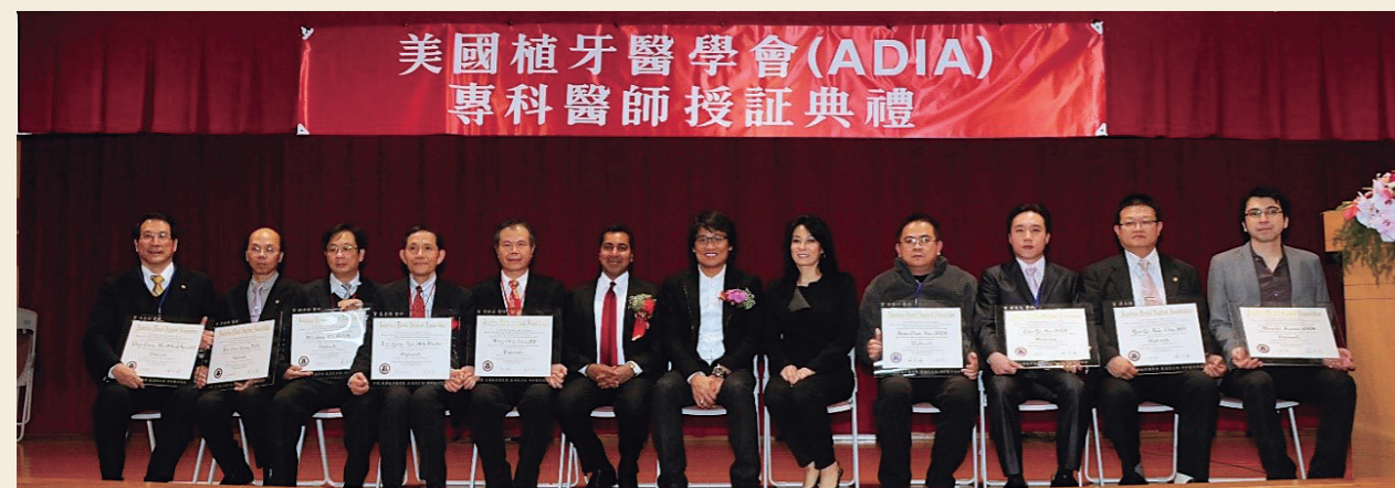
2010 榮獲國際植牙醫學會 (IDIA) 最高院士授證