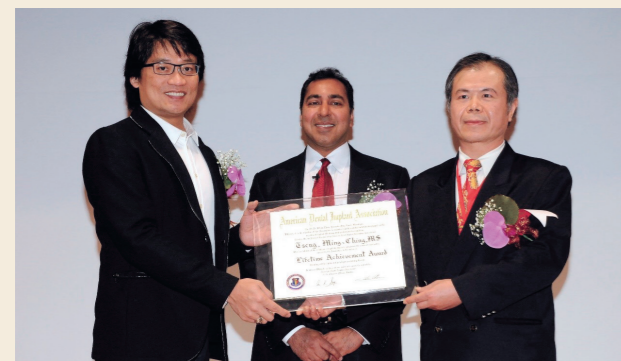
2010 接任國際植牙醫學會 (IDIA) 台灣總會會長

同時，這些種子講師所錄製的課程 (超過 100 小時)，已有近 1000 位牙醫師，在線上學習，且獲益良多。因此，主辦單位特別感謝種子講師的貢獻，已於去年教師節前夕 (2020/09/27)，舉辦第一